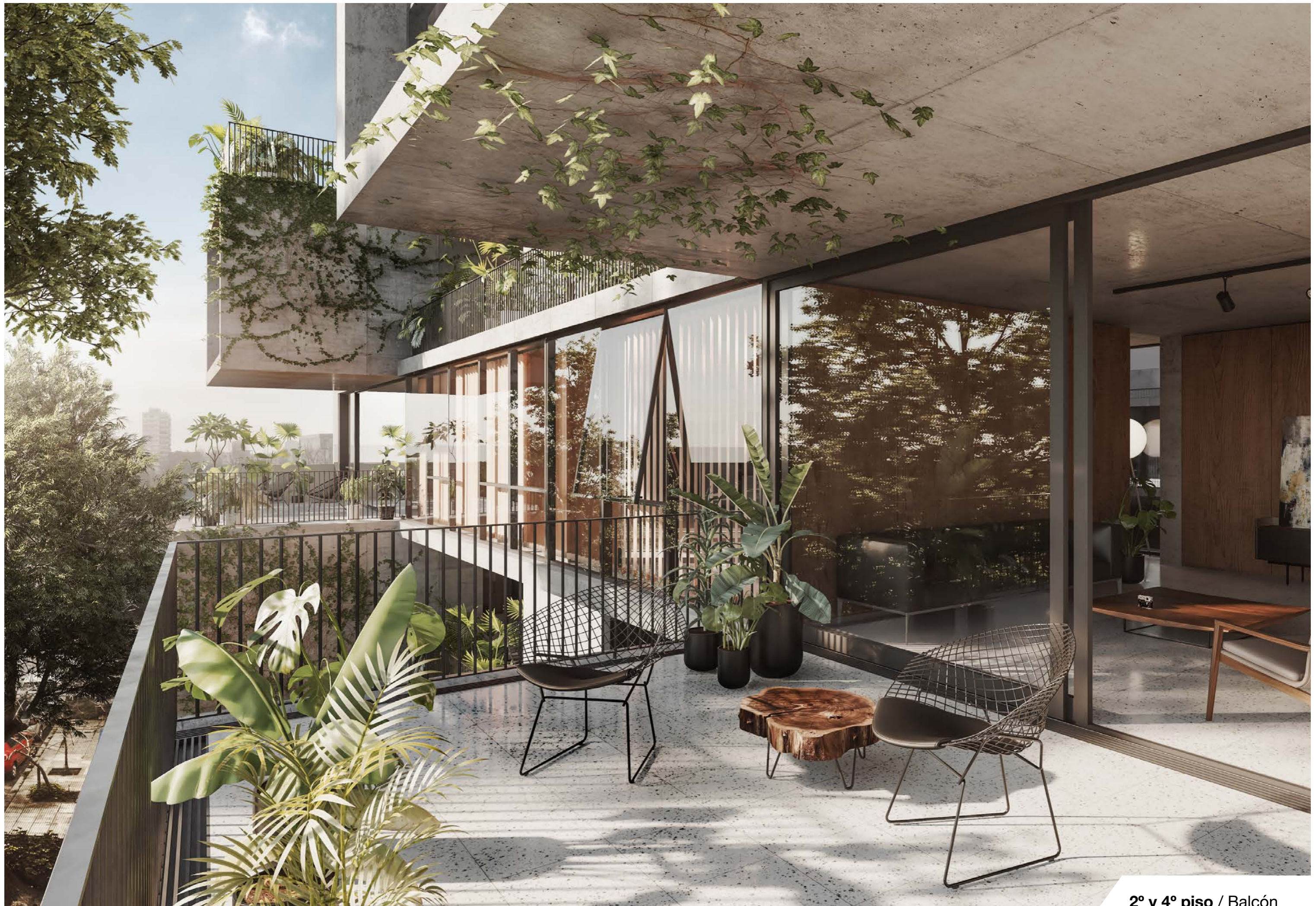
2º y 4º piso / Balcón