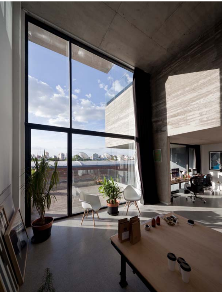
Dorrego 1711, Palermo Edificio residencial