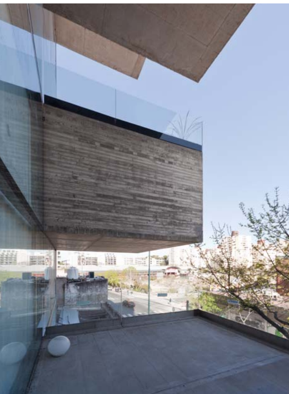
Dorrego 1711, Palermo Edificio residencial

Su obra Clay 2928 recibe el 2º premio de arquitectura edición 2008 del Gobierno de la Ciudad de Buenos Aires en la categoría vivienda multifamiliar. El local Ayres en el Shopping Abasto recibe el premio APSA de oro 2008 y, junto con el local Ayres de Palermo, son seleccionados finalistas en el premio SCA-CPAU 2008, año en el que reciben también el premio Ventanas al Futuro que otorga el CAyC.