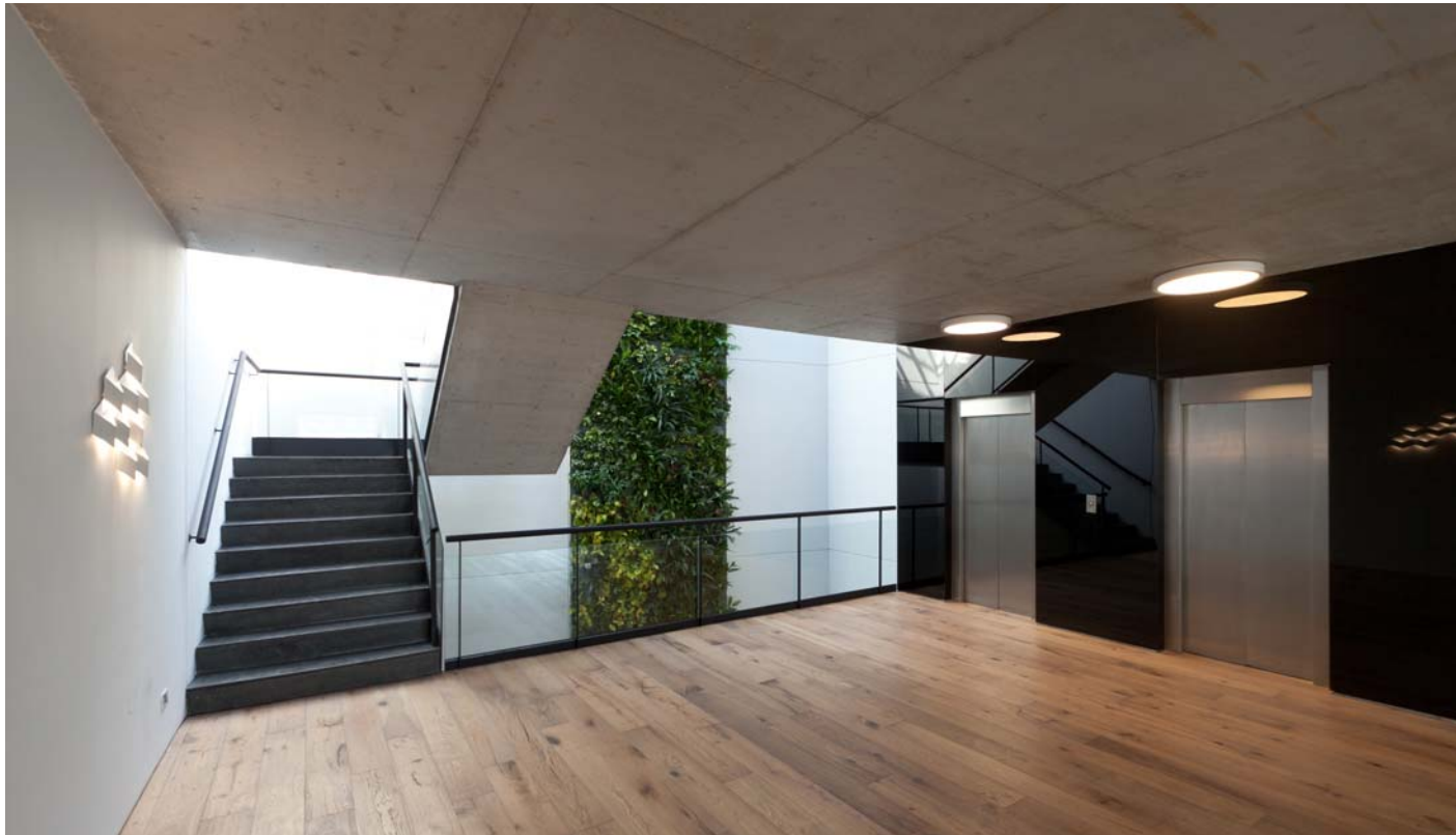
El Salvador 4661, Palermo Espacio coworking