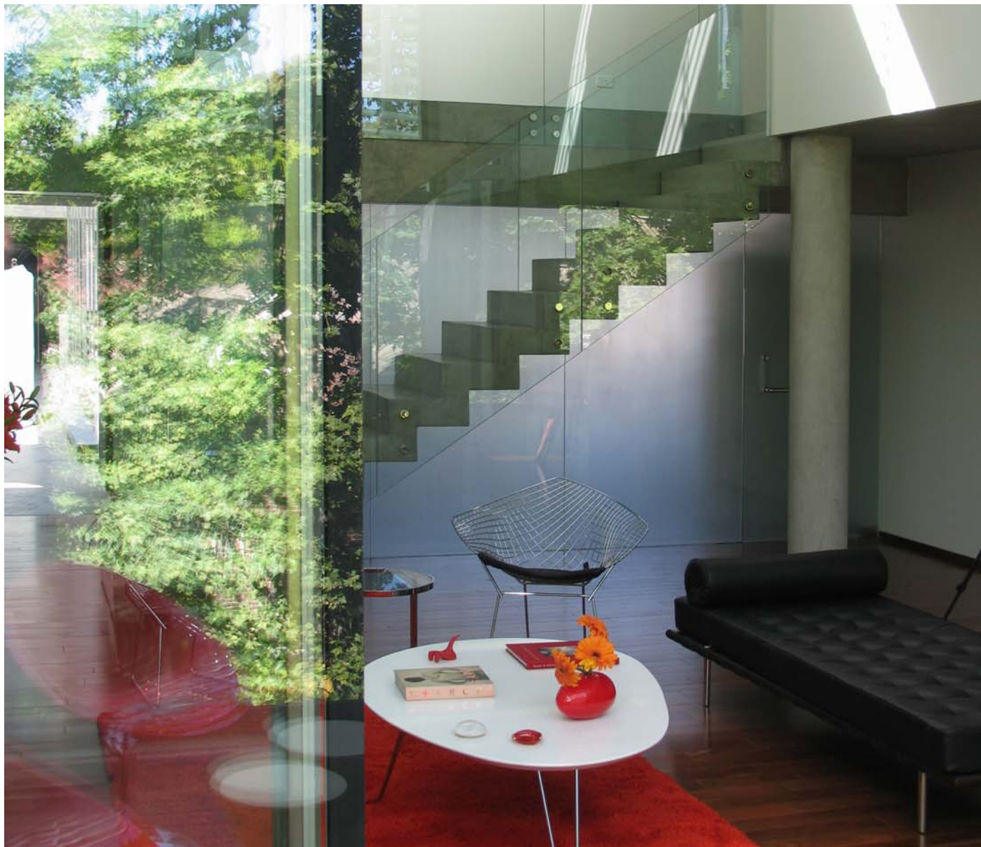
Clay 2928, Cañitas Edificio residencial